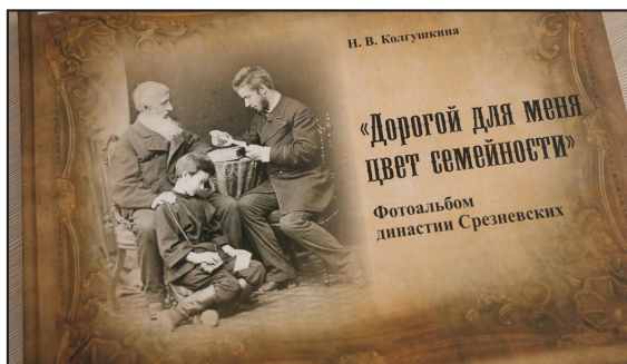
Рис. 1 / Fig. 1. Обложка книги / The book cover

Как стало известно, предки И. И. Срезневского, будучи священниками, служили в Покровском храме села